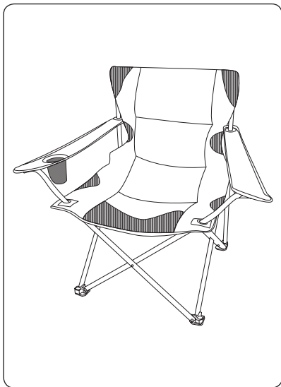
La chaise de camping

Veillez vérifier que l'ensemble des pièces soient présentes avant l'installation de la chaise de camping.